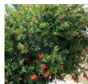
GRÉNADIER À FLEURS