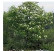
FRÈNE À FLEURS