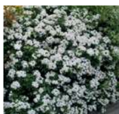
ORANGER DU MEXIQUE