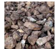
TAS DE CAILLOUX