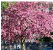
CERISIER À FLEURS